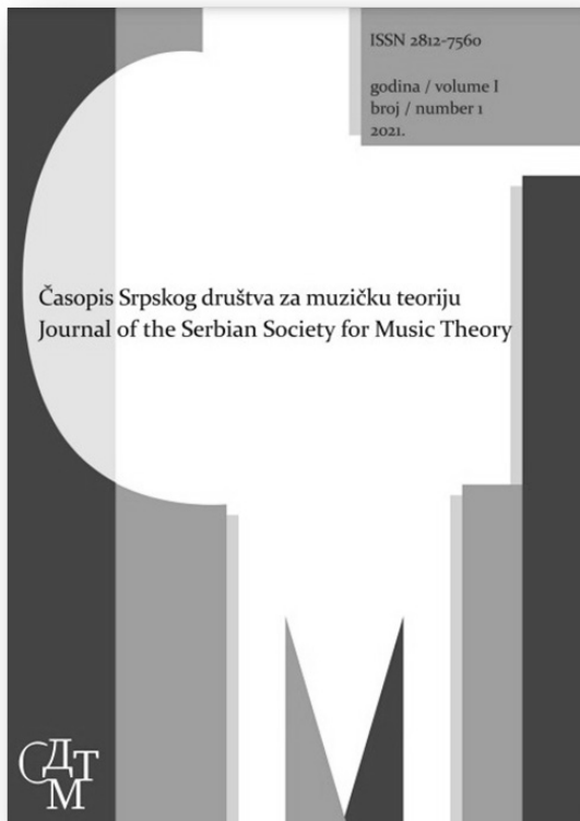
Слика 3. Насловна страна првог броја Часописа Српског друштва за музичку теорију

Поред рада на „подизању” и развоју интернет портала Појмовник музичке теорије , активности Друштва током пандемије усмерене су ка још једном циљу: то је оснивање првог часописа у Србији који је посвећен музичкој теорији. Тако је, у периоду од марта до маја 2021. године, оформљена научна политика часописа, упутство за ауторе, конституисано је уредништво и одређен је назив часописа: Часопис Српског друштва за музичку теорију (слика 3).