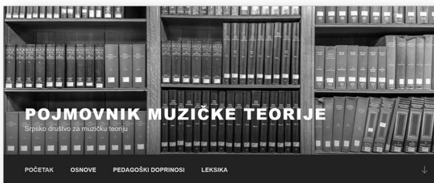
Слика 2. Детаљ са почетне стране интернет портала Појмовник музичке теорије

Српска верзија Појмовника званично је започела са радом у октобру 2021. године, објављивањем првих рецензираних чланака и скенираних материјала. Добра страна „живог” формата као што је интернет портал јесте могућност да се садржаји допуњују и шире, што се у континуитету чини и данас.